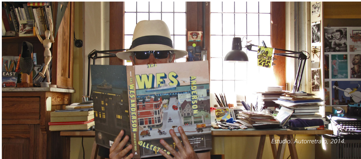
Estudio. Autorretrato, 2014.