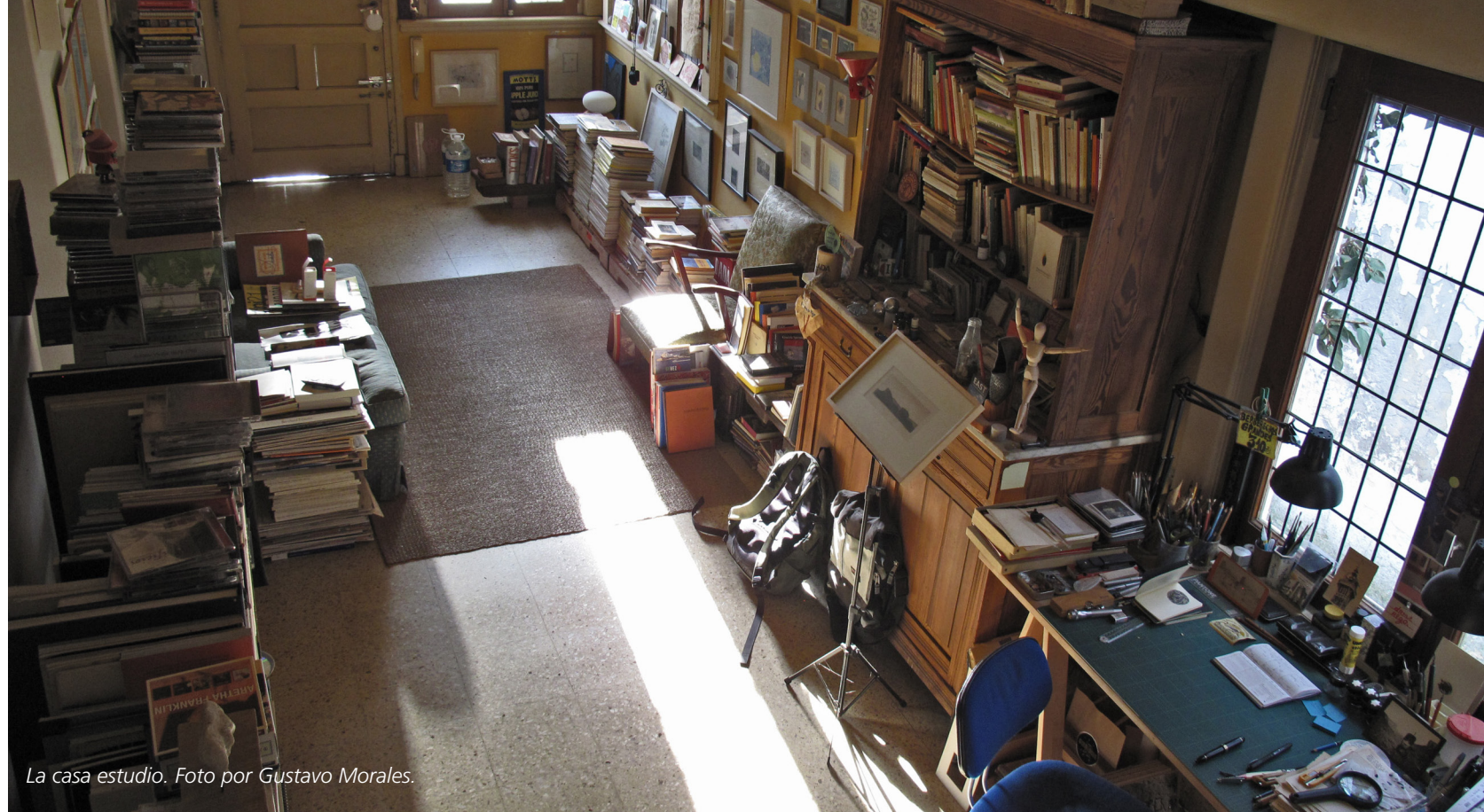
La casa estudio.