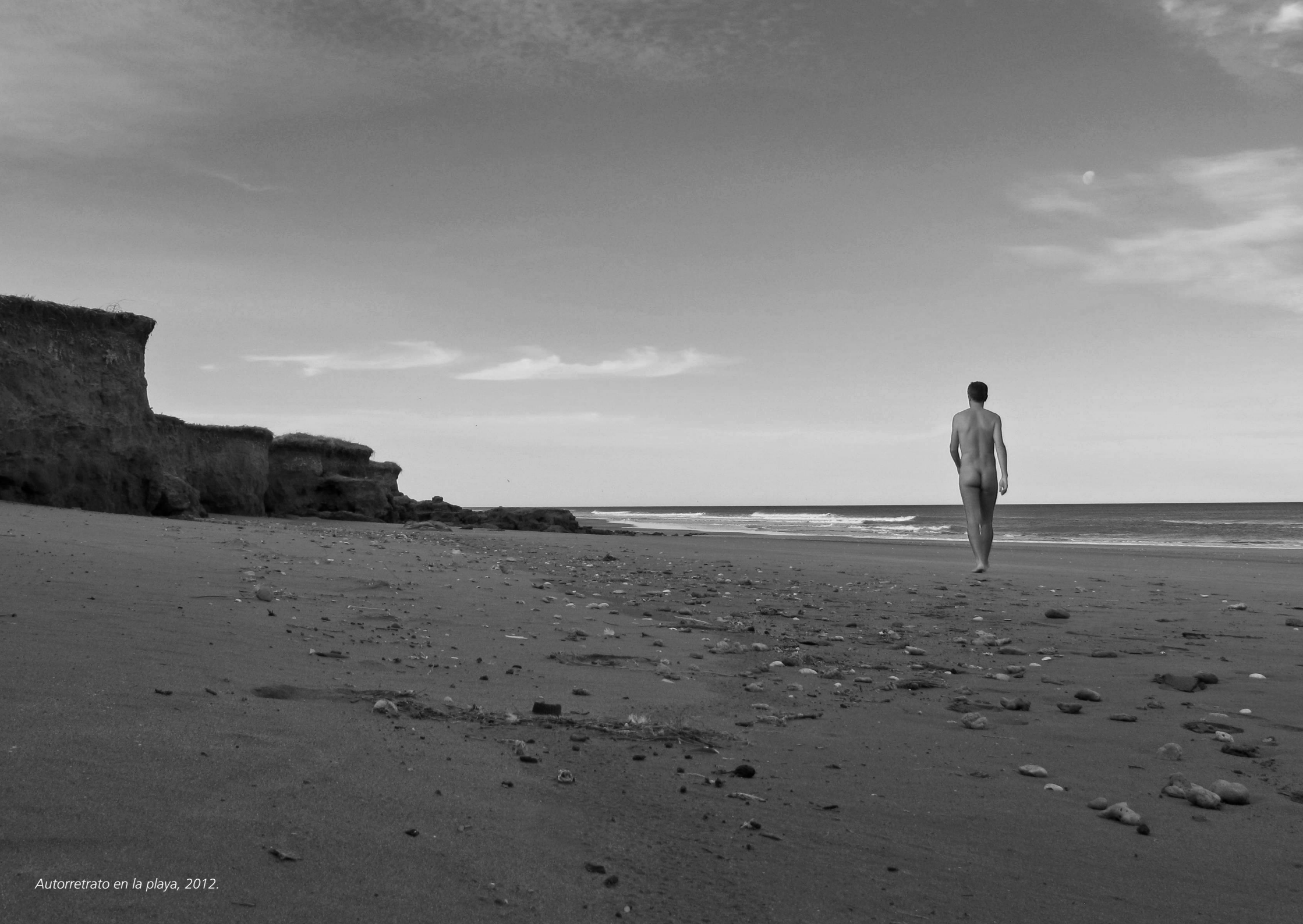
Autorretrato en la playa, 2012.