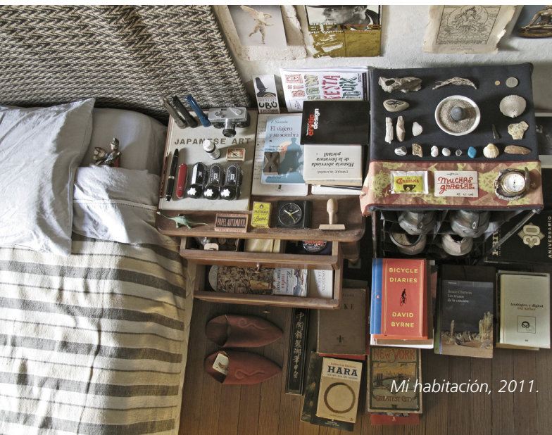
Mi habitación, 2011.

www.innovacion365.com.ar/dia-20-mario-gemin-en-reef